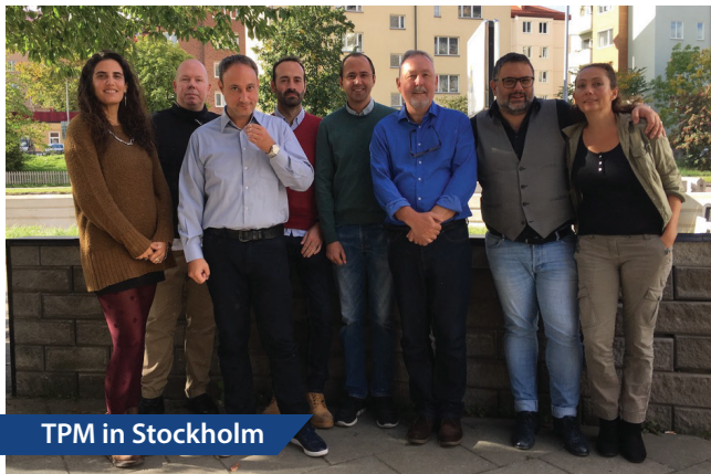
TPM in Stockholm

Contribuire a migliorare le competenze di alfabetizzazione digitale dei migranti. Il modulo fornirà ai formatori volontari linee guida, strumenti, strategie, approcci, tecniche di apprendimento e metodologie per sviluppare ulteriormente le competenze digitali dei migranti, nei seguenti settori: Comunicazione, Gestione delle informazioni, Transazione, Risoluzione dei problemi