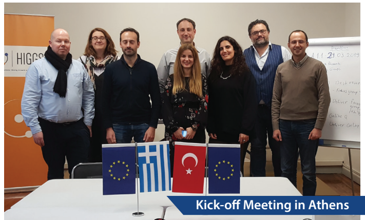
Kick-off Meeting in Athens