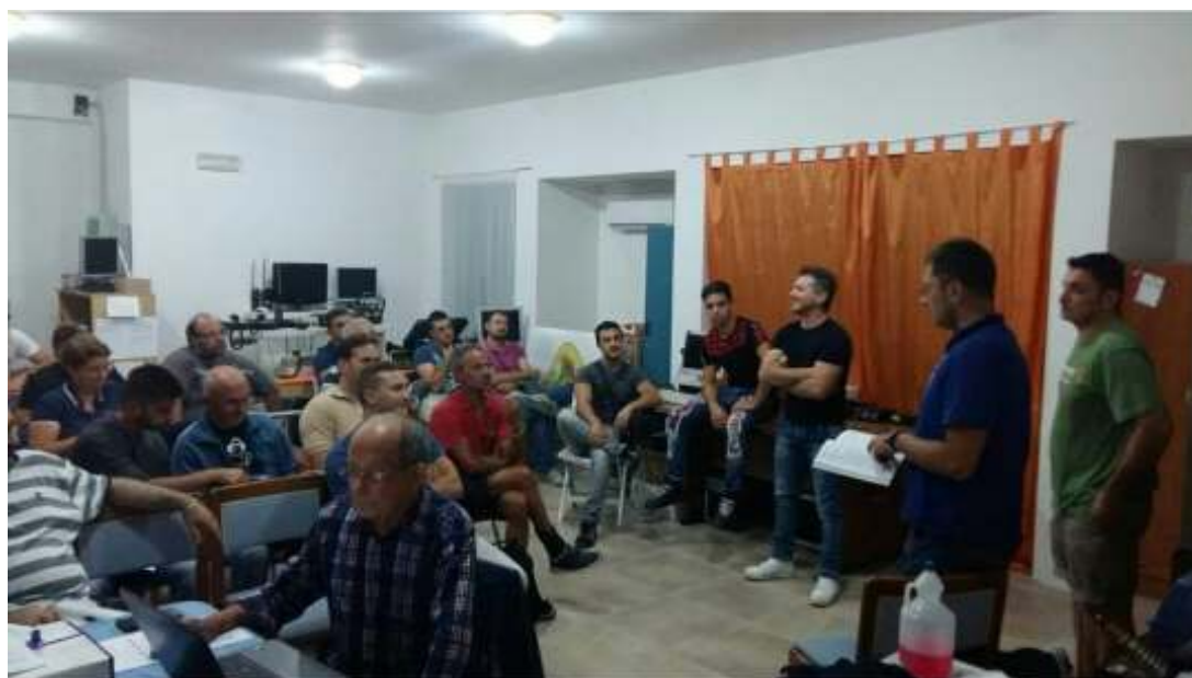
Momenti formativi interni presso l'Academy. Studio delle Radioassistenze, Radioemergenze, dell'elettronica e delle telecomunicazioni