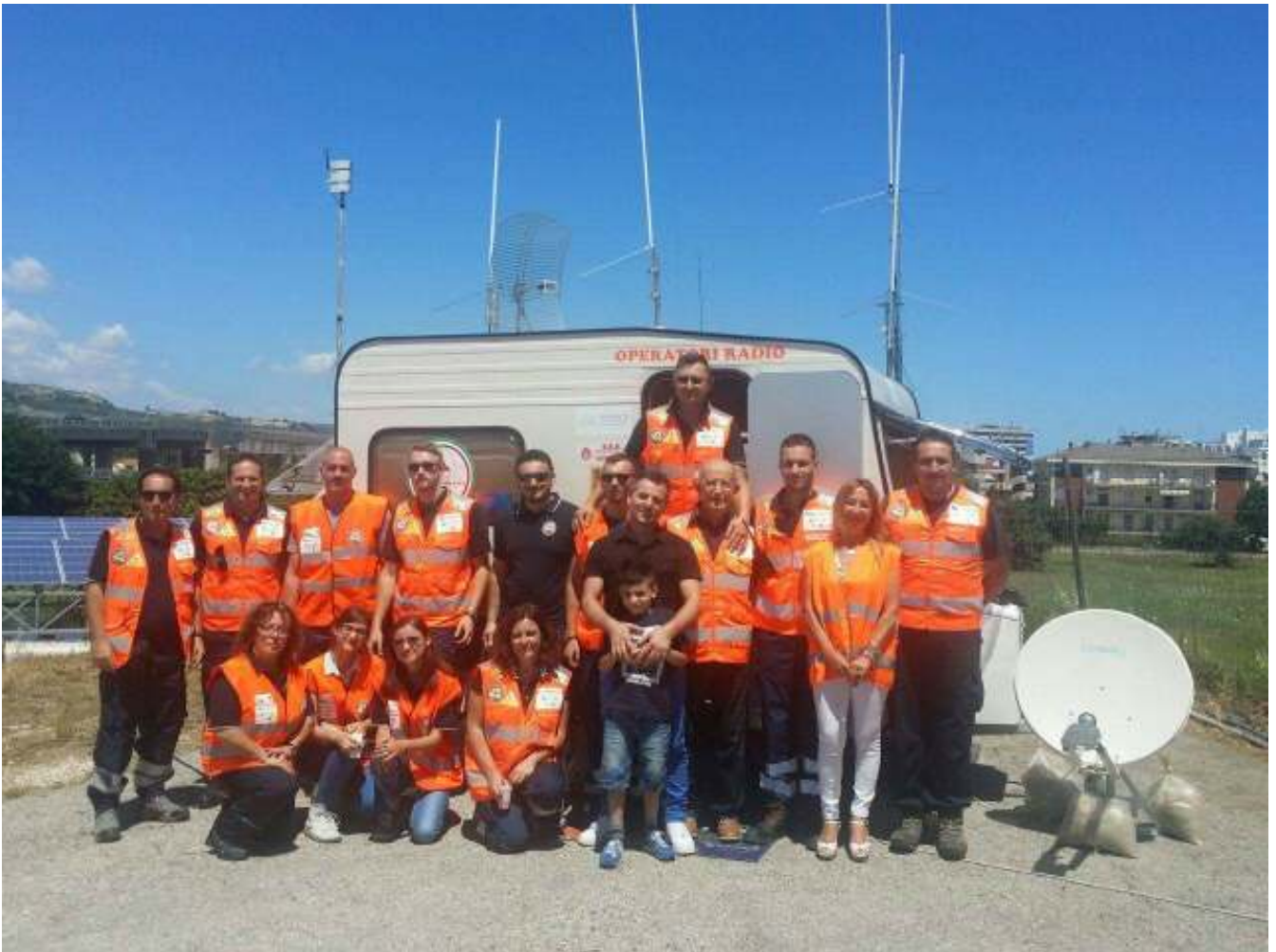
Questi sono i Volontari del Radio Club Piceno

Il Radio Club Piceno è reperibile mezzo numero telefonico attivo H24 - 388/3747990 ; recapito mail: radioclubpiceno@gmail.com