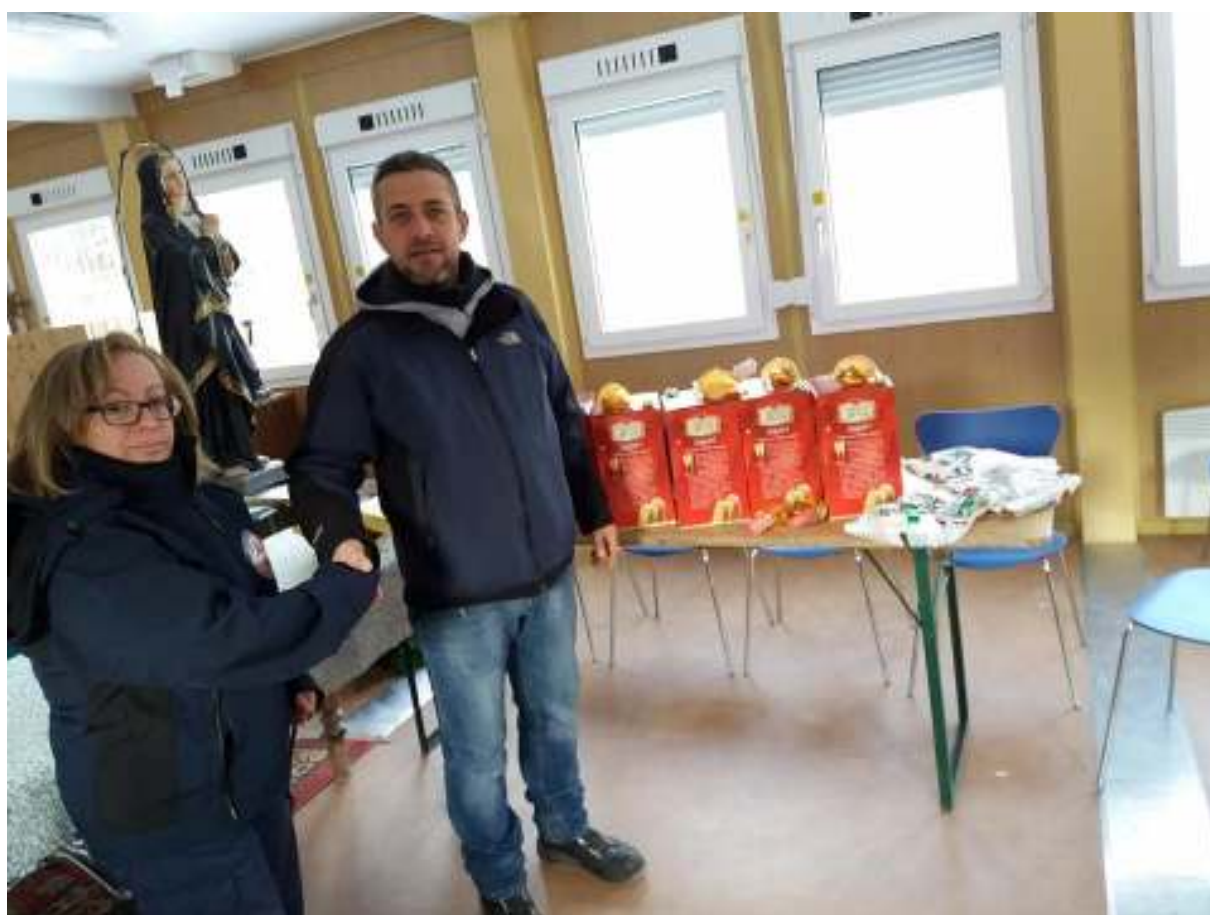
Attività di Volontariato: Consegna Pacchi di Natale 2017 al COC di Montegallo alle Famiglie Terremotate