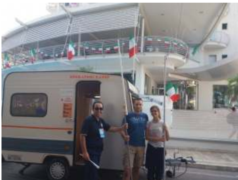
Tra le attività statutarie i volontari del Radio Club Piceno svolgono attività di Radioassistenza per le Freccie Tricolori ad Alba Adriatica