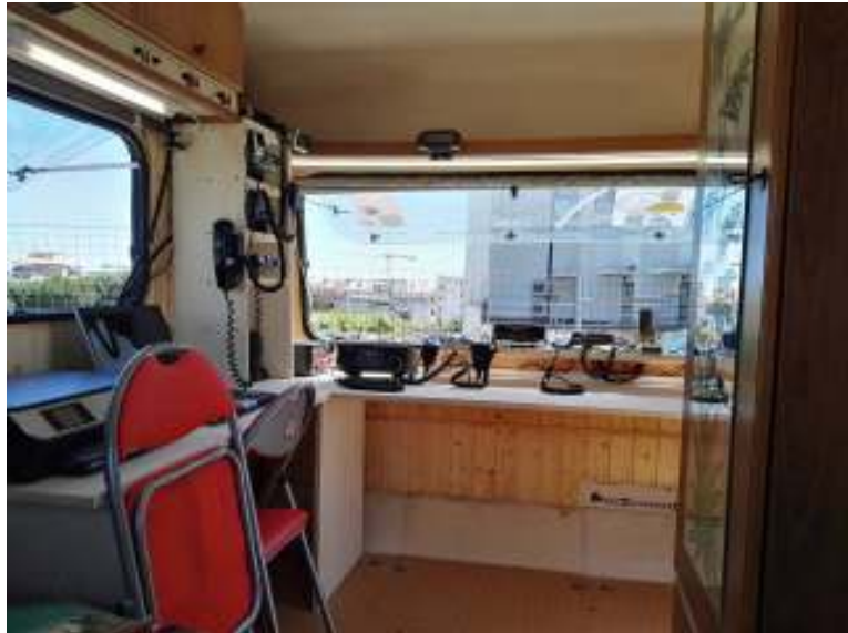
INTERNO SALA OPERATIVA MOBILE