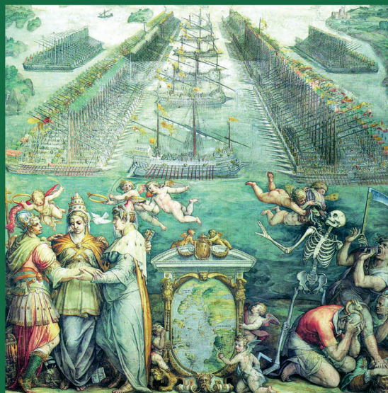
La Marca nella geopolitica del XVI secolo fino alla battaglia di Lepanto

Giorgio Vasari, La battaglia di Lepanto , Sala Regia del Vaticano, XVI sec.