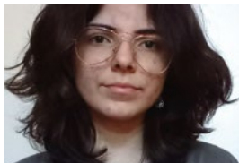
Con Elisabetta L'aggetto del Liceo artistico Cantalamessa (MC)