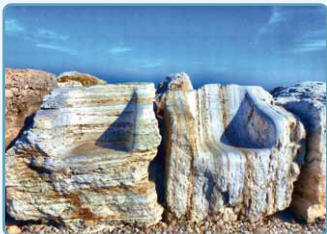
San Benedetto del Tronto

* Per chi fosse interessato, i soci dell'Aisa Marche saranno lieti di condividere il pranzo, previsto all'Hotel ROYAL, con menù di "pesce", al costo di 25 € (esclusi soci Aisa Marche e relatori invitati al convegno).